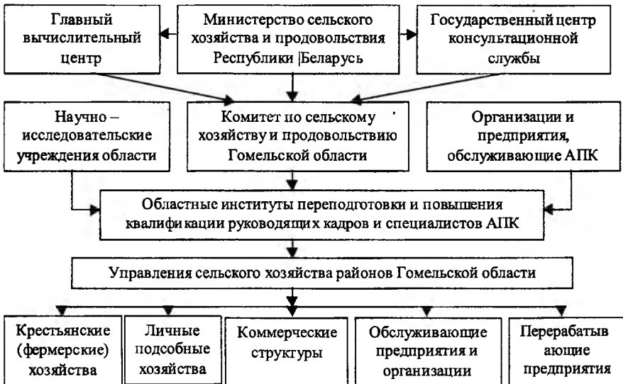
Рис. 3. Структура управления консультационной службой в АПК Гомельской области

Работа по созданию ИКС РБ находится на этапе разработки. Рассмотрим пример создания ИКС на примере Гомельской области. Структура управления консультационной службой в АПК Гомельской области представлена на рис. 3.