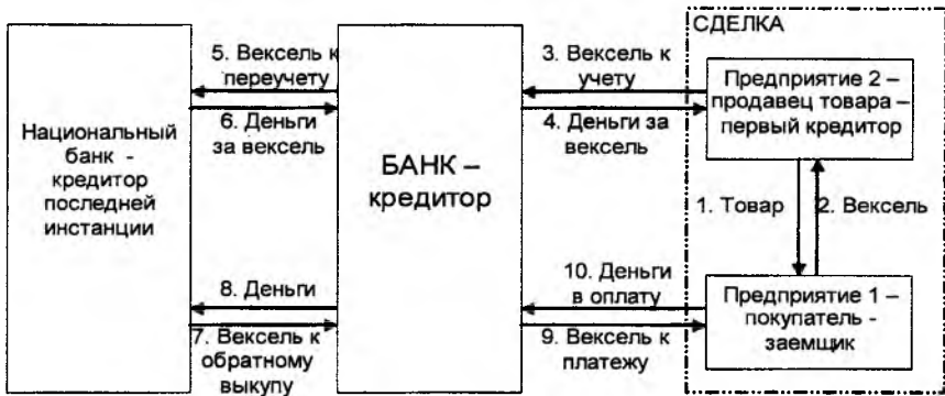
Инфраструктура вексельного обращения в Республике Беларусь

дополнительный учет банками векселей без их переучета в Национальном банке). Обоснована и внедрена в практику Национального банка концепция экспортноориентированной системы учета-переучета векселей.