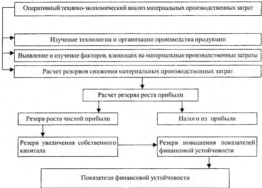
Структурно-логическая модель определения резервов роста показателей финансовой устойчивости предприятия

Для внутренних пользователей аналитической информации весьма важно определить резервы укрепления финансовой устойчивости предприятия и разработать меры по их реализации. Для этого необходимо изучить и оценить первичные факторы, связанные с технологическим процессом производства. Важнейшим из них являются материальные производственные затраты, составляющие 81% в себестоимости продукции предприятий молочной промышленности. В связи с этим в качестве одного из направлений развития и совершенствования финансового анализа в диссертационной работе предлагается методика углубленного оперативного анализа финансовой устойчивости с учетом технологических особенностей предприятий молочной промышленности, представленная на рисунке.