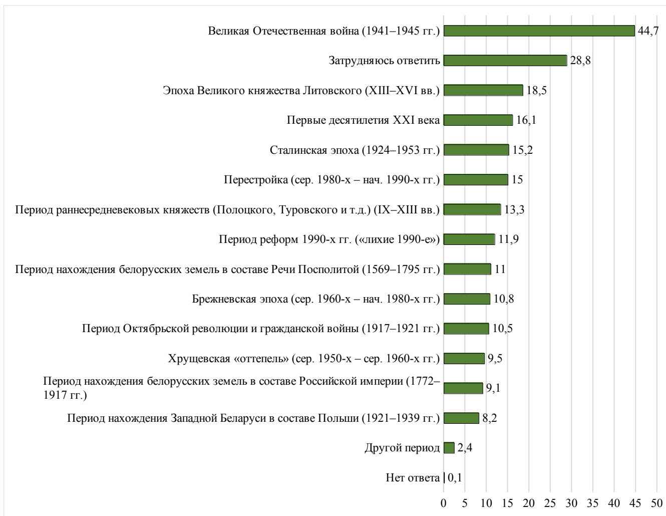
Рисунок 3.1 – Мнения респондентов о наиболее интересных периодах истории Беларуси, %

Важным аспектом исторической памяти любого общества является отмечание различных праздников и памятных дат. Возникающие у индивидов в ходе осуществления данной социокультурной практики ощущения общности и сопричастности на основе разделяемой истории способствуют поддержанию культурных и духовных связей, которые в свою очередь являются неотъемлемой составляющей дальнейшего благополучия общества. Так, в рамках данного исследования респондентам задавался два вопроса, один из которых затрагивал праздничные и памятные даты, имеющие значимость на государственном уровне, а второй касался международных и общенациональных, а также народных и религиозных праздников.