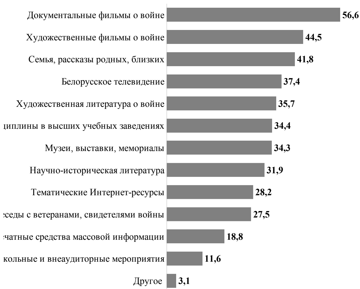
Рисунок 2 Распределение ответов на вопрос: «Из каких источников Вы получаете информацию о Великой Отечественной войне?» (в %)

Закономерным является то, что у молодежи получение информации о Великой Отечественной войне чаще осуществляется через обращение к тематическим интернет-ресурсам, школьной программе и дисциплинам в высших учебных заведениях, тогда как представители среднего и старшего поколения больше ее получают из информационных материалов белорусского телевидения, рассказов членов семьи, родных и близких, художественных и документальных фильмов о войне и литературы.