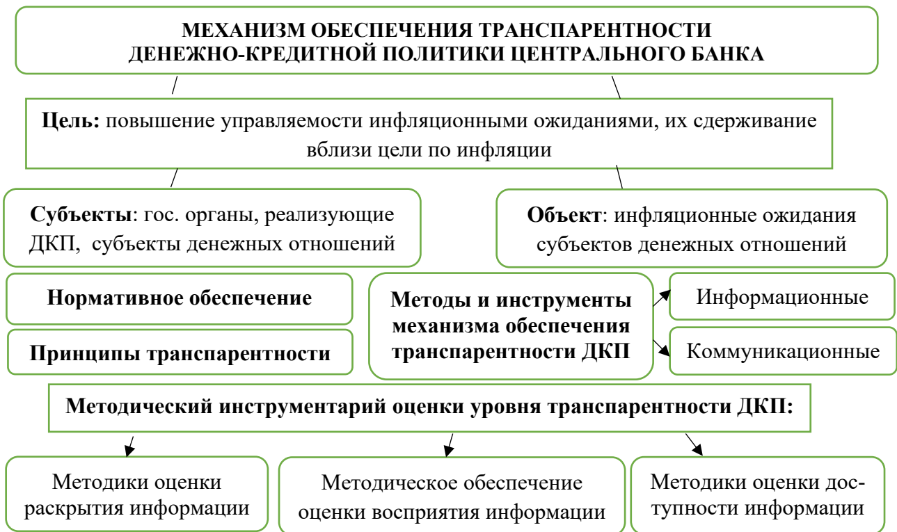
Рисунок 1. – Механизм обеспечения транспарентности ДКП центрального банка

Дано определение понятие «механизм обеспечения транспарентности ДКП центрального банка», под которым понимается совокупность процедур, методов и инструментов информационно-коммуникационного характера, направленных на повышение информационной открытости, общепонятности и доступности ДКП в целях увеличения управляемости инфляционных ожиданий экономических субъектов, а также его состав и структура (рисунок 1).