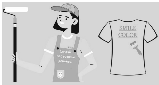
Рисунок 3 – Фирменная одежда менеджера-консультанта