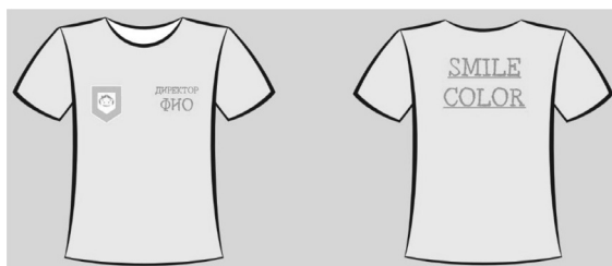
Рисунок 4 – Фирменная одежда директора

Директорам компании стоит добавить должность спереди майки, полностью вышитое ФИО и оттенок майки сделать салатового цвета (Рисунок 4).