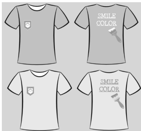
Рисунок 6 – Фирменные сувенирные майки

Сувенирная продукция. Оранжевые и зеленые майки с элементами фирменного стиля организации сможет получить каждый покупатель, осуществив покупки с общей стоимостью 600 белорусских рублей и более. Майка представлена размера oversize и подойдет каждому (Рисунок 6).