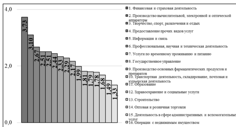
Рис. 2. Инвестиционная специализация г. Минска за период 2017–2021 гг. (накопительным эффектом) (составлено автором на основе данных Национального статистического комитета Республики Беларусь)

Данный факт определен тем, что в столице проживает пятая часть населения, здесь сосредоточена деловая активность Республики Беларусь, поэтому спрос на услуги в Минске больше в сравнении с другими регионами, а соответственно, и инвестиционная активность видов экономической деятельности, относящихся к третичному сектору, будет выше [4].