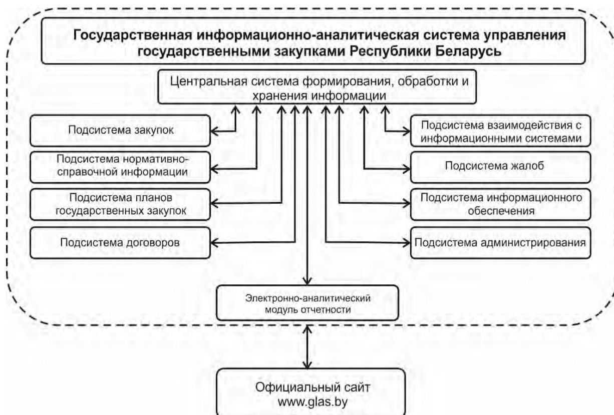
Рисунок 4. — Структурная схема ГИАС

Одним из основных достоинств внедрения ГИАС в СГЗ является создание возможности подготовки аналитической информации на базе статистических данных, собираемых в ГИАС.