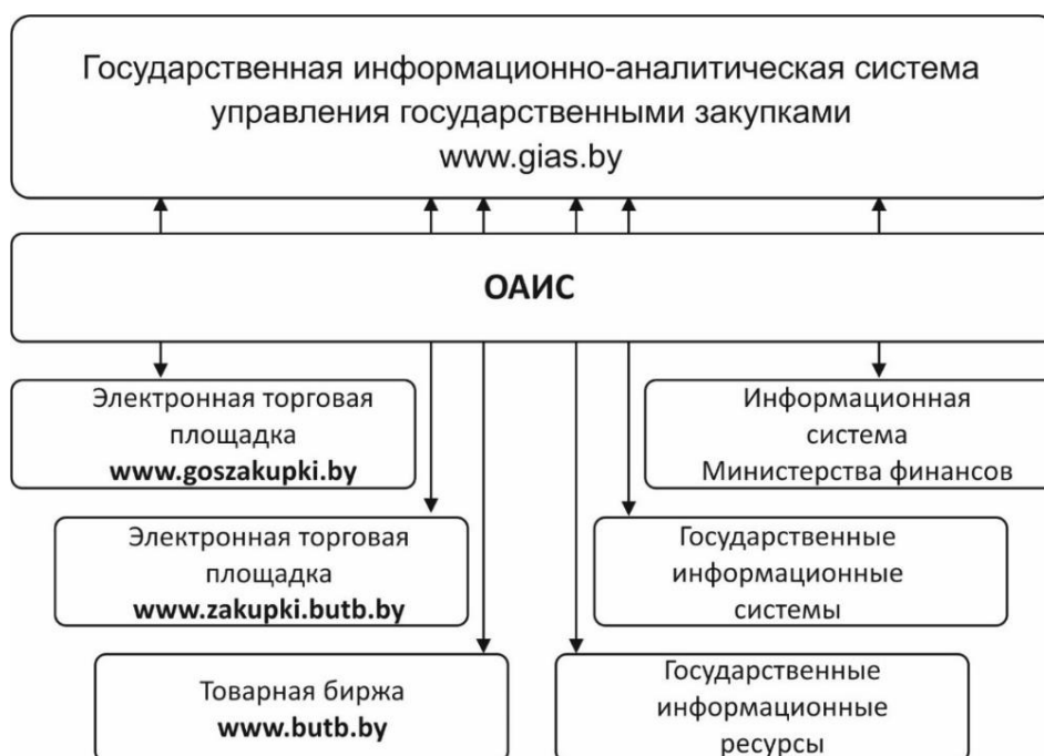
Рисунок 3. — Структурная схема СГЗ в Республике Беларусь