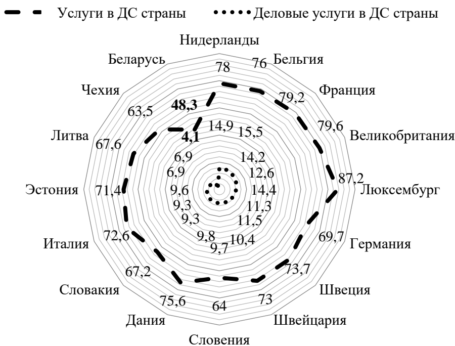
Рисунок 2 — Удельный вес «Прочих деловых услуг» и всех видов услуг в добавленной стоимости (ДС) европейских стран и Республики Беларусь за 2021 г., %

ежегодно), фрагментация производства и потребления услуги и, как следствие, включение развивающихся стран (Коста-Рика, Филиппины) в звенья ГЦДС с высокой добавленной стоимостью (61 % интеллектуальные услуги и 39 % процессные услуги), субконтрактация из числа менее развитых стран (передача бизнес-процессов из Индии в Филиппины).