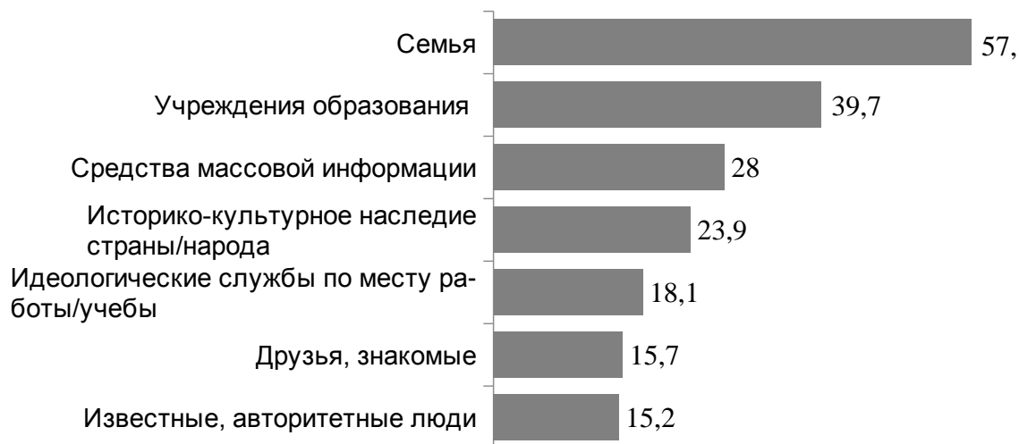
Рисунок 2 – Распределение ответов респондентов на вопрос «Кто/что влияет на формирование патриотических качеств у населения?», в%

Как правило, в качестве основных институтов, ответственных за формирование у граждан патриотических чувств и настроений рассматриваются семья, образование и государство. По мнению белорусов, на становление патриотических ценностей влияние оказывает прежде всего семейное воспитание (57,9 %) и институциональное образование (39,7 %). Отмечается также роль средств массовой информации, историко-культурного наследия страны/народа. Несколько реже гражданами упоминается роль идеологических служб по месту работы/учебы, друзей, знакомых, известных авторитетных людей (см. Рисунок 2).