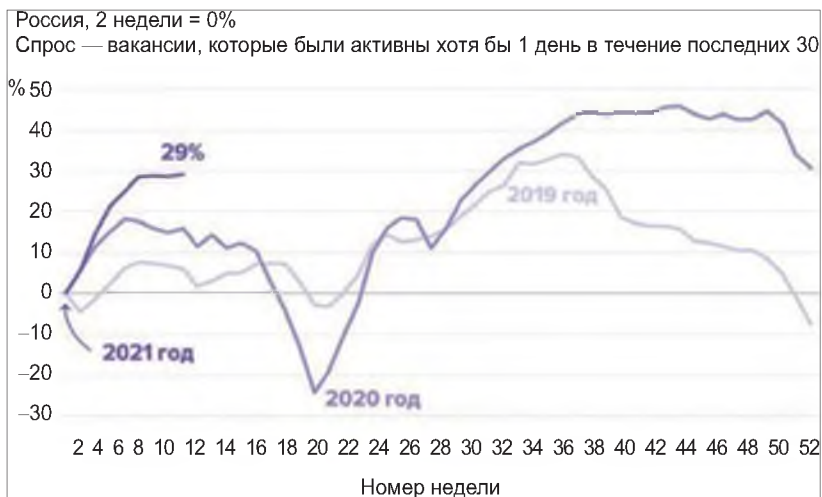
Рис. 2. Спрос вакансий

На рис. 2 представлена динамика спроса активных вакансий на российском рынке труда.