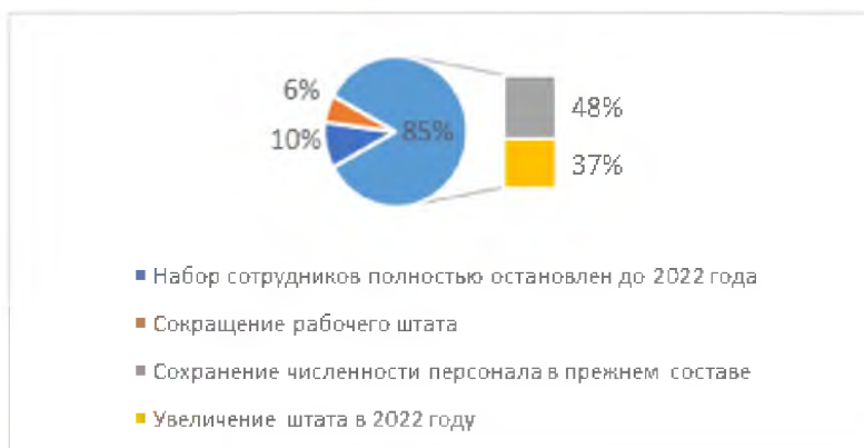
Рис. 4. Опрос Haус среди работодателей

В настоящее время наиболее востребованными являются специалисты в промышленности. Данный факт связан в первую очередь с тем, что промышленность, используя современные инновационные технологии, масштабно развивается, появляются новые проекты, новые производственные площадки. Единственной проблемой данной отрасли остаются кадры, а именно обострение конкуренции за инженеров и профессиональных рабочих, энергетиков, контролеров ОТК, слесарей, сборщиков и других специалистов. Интересным фактом является то, что, несмотря на нестабильную мировую обстановку, промышленность осталась единственным сектором стабильного кадрового состава [2]. Стоит отметить, что наряду с востребованностью специалистов в промышленной отрасли с небольшим отставанием лидирует сфера услуг, в которой аналогично предшествующему стоит вопрос острой нехватки квалифицированных кадров. В острый период пандемии команда Haус провела опрос среди работодателей с целью уточнения их дальнейших планов в части, касающейся сотрудников своих компаний. Результат опроса представлен на рис. 4.