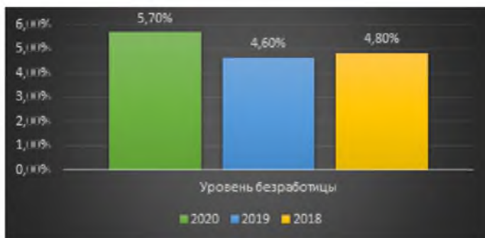
Рис. 1. Уровень безработицы в России

Население Российской Федерации столкнулось с ситуацией, когда помимо быстрорастущей цифровизации на безработицу оказала влияние и пандемия, начавшаяся в конце 2019 г. На рис. 1 представлен уровень безработицы в России (по данным Росстата) в период с 2018 по 2020 г. [1].