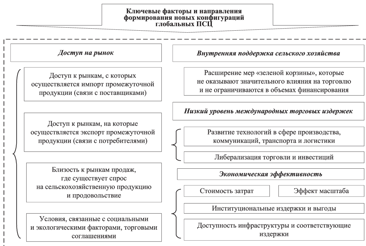
Рис. 3. Ключевые факторы и направления формирования новых конфигураций глобальных ПСЦ в сельском хозяйстве и пищевой промышленности