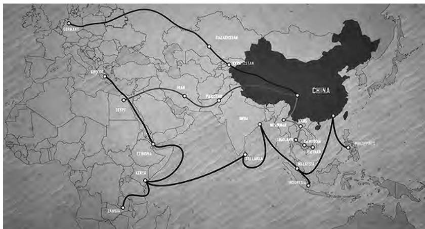
Рисунок 1 — Место Республики Беларусь на карте «Нового Шелкового пути»

Схематично место Республики Беларусь на карте «Нового Шелкового пути» представлено на рисунке 1 [3, с. 43].