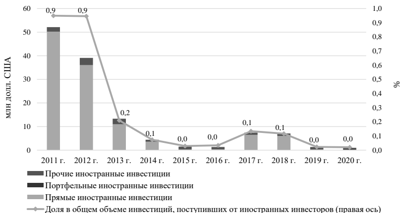
Рисунок 4 — Динамика и структура инвестиций резидентов Республики Беларусь в Китай в 2011–2020 гг.

Примечание. Источник: разработка автора на основе данных Белстата.