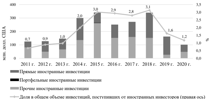
Рисунок 2 — Динамика и структура притока китайских инвестиций (на валовой основе) в Республику Беларусь в 2011–2020 гг.

Инвестиции Китая в Республику Беларусь. Инвестиционное сотрудничество является основой белорусско-китайских внешнеэкономических отношений. Если в 2011–2013 гг. доля китайских инвестиций в общем объеме поступивших иностранных инвестиций в экономику Республики Беларусь на валовой основе составляла не более 1,0%, то в 2014–2020 гг. — в среднем составила 2,4%. Доля китайских инвестиций в общем объеме иностранных инвестиций в экономику Республики Беларусь увеличивалась вплоть до 2018 г. (3,1%), затем за счет снижения капиталовложений на фоне пандемии данный показатель сократился до 1,2% в 2020 г. Объем инвестиций из Китая в национальную экономику в 2020 г. по сравнению с предыдущим годом снизился на 18,7% (рисунок 2).