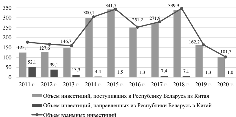
Рисунок 1 — Динамика взаимных инвестиций (на валовой основе) Республики Беларусь и Китая в 2011–2020 гг., млн долл. США

Приток инвестиций Китая в Беларусь на валовой основе до 2018 г. имел устойчивый тренд роста и увеличился по сравнению с 2011 г. в 2,7 раза, составив 339,9 млн долл. США. В 2020 г. на фоне пандемии COVID-19, в результате чего реализация ряда инвестиционных проектов была приостановлена либо полностью прекращена в силу объективных причин, привлечение китайского капитала в Беларусь резко сократилось и составило 101,7 млн долл. США, что является минимальным значением за последние годы (рисунок 1). Инвестиции белорусских компаний в Китай в 2020 г. составили 1,0 млн долл. США, что в 52,1 раза меньше, чем в 2011 г.