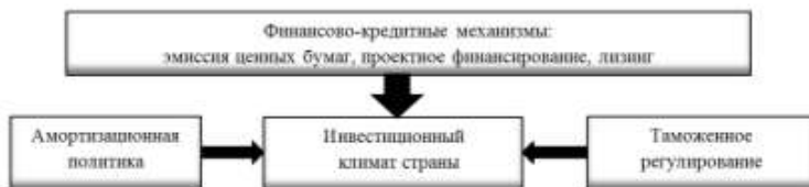
Рисунок 1 - Инструменты формирования и развития инвестиционного климата в стране

Примечание – Источник: собственная разработка автора