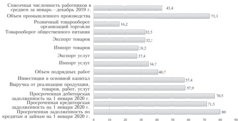
Рис. 3. Удельный вес организаций государственной и с долей государственной собственности в основных экономических показателях Республики Беларусь, %

В соответствии с разработанным алгоритмом (см. рис. 2) обратимся к анализу текущих данных статистической отчетности реального сектора национальной экономики. Так, согласно отчету Национального статистического комитета 73,3 % объема промышленного производства приходится на организации с государственной и долей государственной собственности, при этом удельный вес выручки в общем объеме Республики Беларусь составляет 57,9 % (рис. 3).