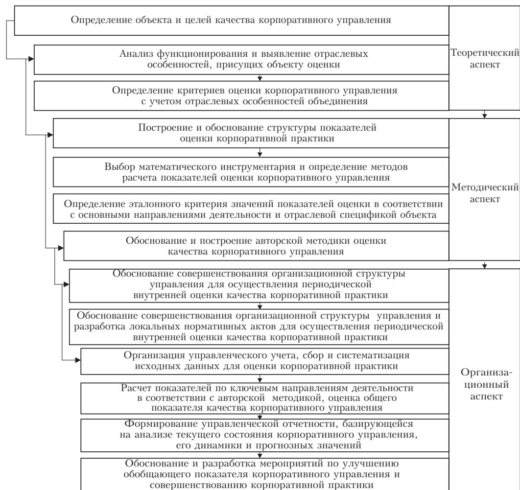
Рис. 2. Алгоритм построения внутренней оценки качества корпоративного управления

Теоретический аспект представленного алгоритма основан на определении объекта оценки качества корпоративного управления. В данном ключе для разработки унифицированной методики оценки корпоративной практики крупных белорусских экономических объединений ключевым критерием выбора являются значительный вклад в общий ВВП Республики Беларусь и высокая стратегическая значимость для обеспечения экономической безопасности и общего благосостояния страны. В качестве цели оценки корпоративной практики выступает анализ и формирование видения системного процесса управления интегрированным экономическим объединением и процессом осуществления его эффективной деятельности путем реализации корпоративных целей.