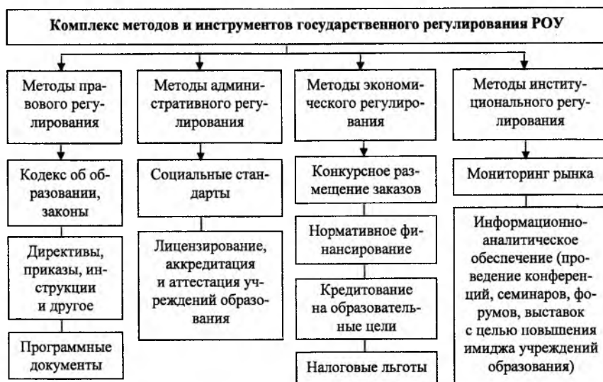
Рисунок 1 — Методы и инструменты государственного регулирования рынка образовательных услуг

В целях устранения противоречий в процессе взаимодействия рынка образовательных услуг и рынка труда обоснован комплекс методов и инструментов государственного регулирования (рисунок 1).