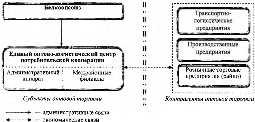
Рисунок 3 — Предлагаемая организационно-экономическая модель оптовой торговли потребительской кооперации

В третьей главе «Развитие модели управления оптовой торговлей потребительской кооперации в Республике Беларусь» предложена усовершенствованная организационно-экономическая модель управления оптовой торговлей потребительской кооперации (рисунок 3).