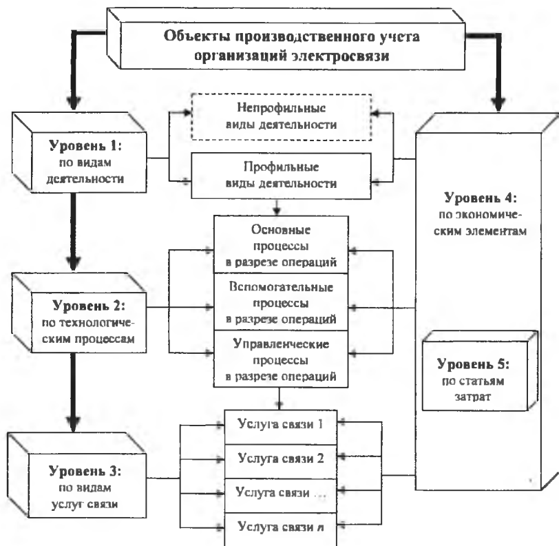
Рисунок 1 — Объекты производственного учета и их классификация в организациях электросвязи

Авторский комплексный подход к затратам производства как объекту производственного учета соответствует сложности и динамизму деятельности организаций связи, учитывает специфику конкретной подотрасли электросвязи в современных условиях, что позволяет отслеживать формирование затрат профильных видов деятельности в разрезе элементов и статей по двум группам объектов: 1) услугам — в целях расчета себестоимости; 2) технологическим процессам — для контроля за уровнем затрат.