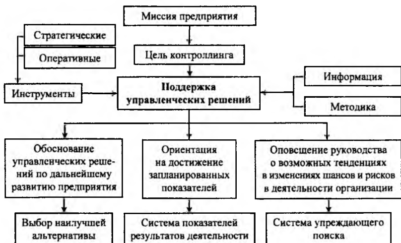
Рисунок 1 — Принципиальная схема контроллинга на предприятии

щий собой скоординированную систему действий по обеспечению информационно-методической, организационной и аналитической поддержки менеджмента предприятия (рисунок 1).