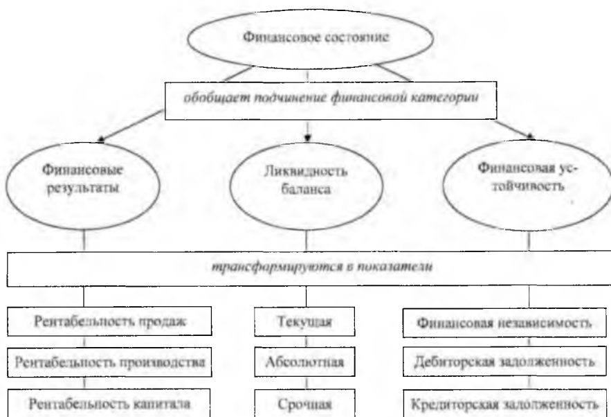
Рисунок 2 — Схема детализации финансового состояния

Примерная схема детализации категории финансового состояния малых предприятий в наиболее общем виде представлена на рисунке 2.