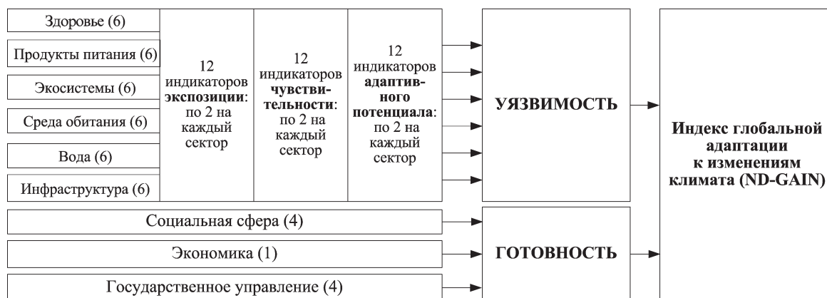
Рис. 2. Структура Индекса глобальной адаптации к изменениям климата

Соответственно, для формирования индекса ND-GAIN определяются 36 индикаторов уязвимости (Vulnerability Indicators) и 9 индикаторов готовности (Readiness Indicators) (рис. 2, табл. 2), которые масштабируются по-