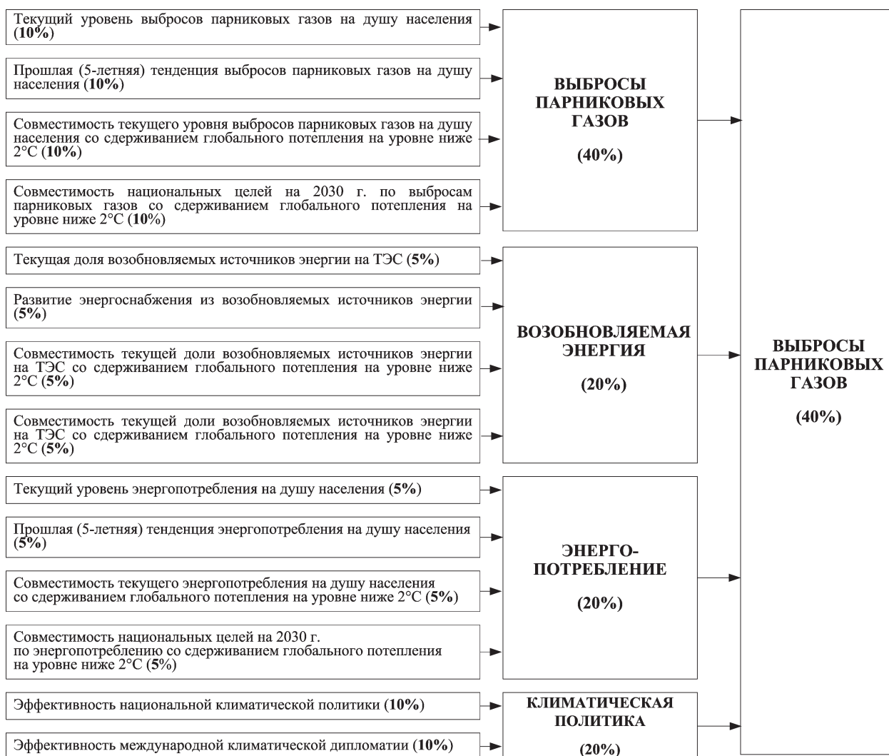
Рис. 3. Структура Индекса эффективности действий в области изменения климата

Источник. Авторская разработка на основе (Burck, Hagen, Hцhne, Nascimento, Bals, 2020).