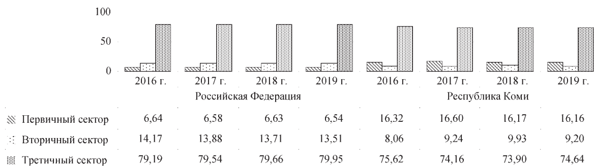
Рис. 1. Секторальная структура НДС в Российской Федерации и Республике Коми, 2016–2019 гг., %

Источник. Данные статистической отчетности ФНС РФ. URL: https://www.nalog.ru/