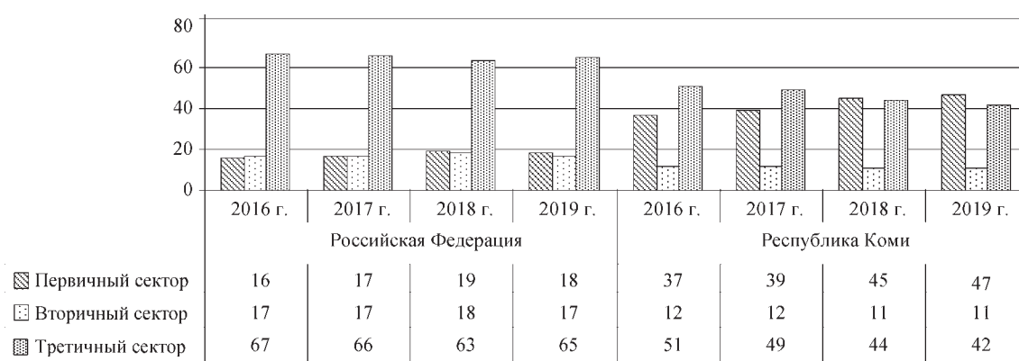
Рис. 2. Секторальная структура валовой добавленной стоимости Российской Федерации и Республики Коми, 2016–2019 гг., %