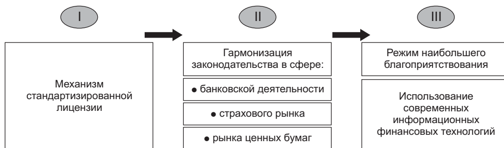
Рис. 2. Этапы гармонизации национальных законодательств финансового рынка ЕАЭС

Концепцией формирования общего финансового рынка Евразийского экономического союза, утвержденной 1 октября 2019 г., определена база для обеспечения свободного движения капитала и услуг. Целью совершенствования законодательства государств — членов Союза является установление гармонизированных правил правового регулирования общего финансового рынка в условиях сохраняющихся различий, не препятствующих эффективному функционированию общего финансового рынка ЕАЭС. Предусматривается проведение поэтапной разноскоростной гармонизации и одновременно по трем секторам (банковский, страховой рынок и рынок ценных бумаг). Обусловлено это тем, что необходимо учитывать модели и особенности правового регулирования финансовых рынков государств — членов Союза и степень имплементации международных стандартов, а также необходимость минимизации рисков для финансовой стабильности национальных рынков участников евразийской интеграции и общего финансового рынка ЕАЭС (рис. 2).