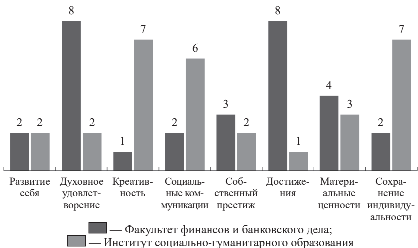
Рис. 1. Количественные показатели распределения испытуемых разных групп по ведущим ценностным ориентациям