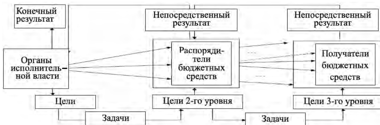
Рисунок 2. — Организационно-функциональная модель взаимодействия администраторов бюджетных средств

С целью повышения эффективности непрограммных расходов предложено внедрить контрактную модель бюджетного финансирования, предусматривающую: а) заключение контракта между администраторами о достижении результатов при осуществлении государственных расходов и распределении ответственности между ними на основе предложенной организационно-функциональной модели взаимодействия администраторов (рисунок 2); б) финансирование бюджетного учреждения с учетом результатов оценки эффективности его расходов.