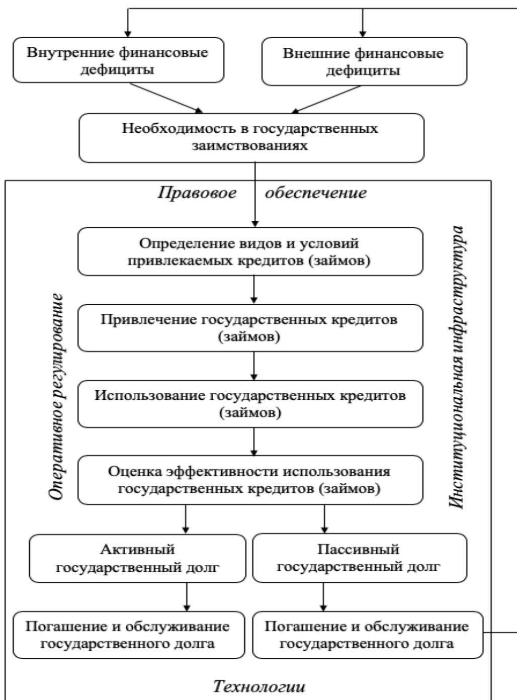
Рисунок 1. — Логическая схема долгового механизма в экономике

Во второй главе «Анализ и оценка государственного долга Республики Беларусь» рассмотрены и выделены четыре этапа развития государственного долга Республики Беларусь, определены внутренние и внешние финансовые дефициты как факторы государственного долга Республики Беларусь, разработан методический подход к оценке эффективности государственного долгового портфеля.