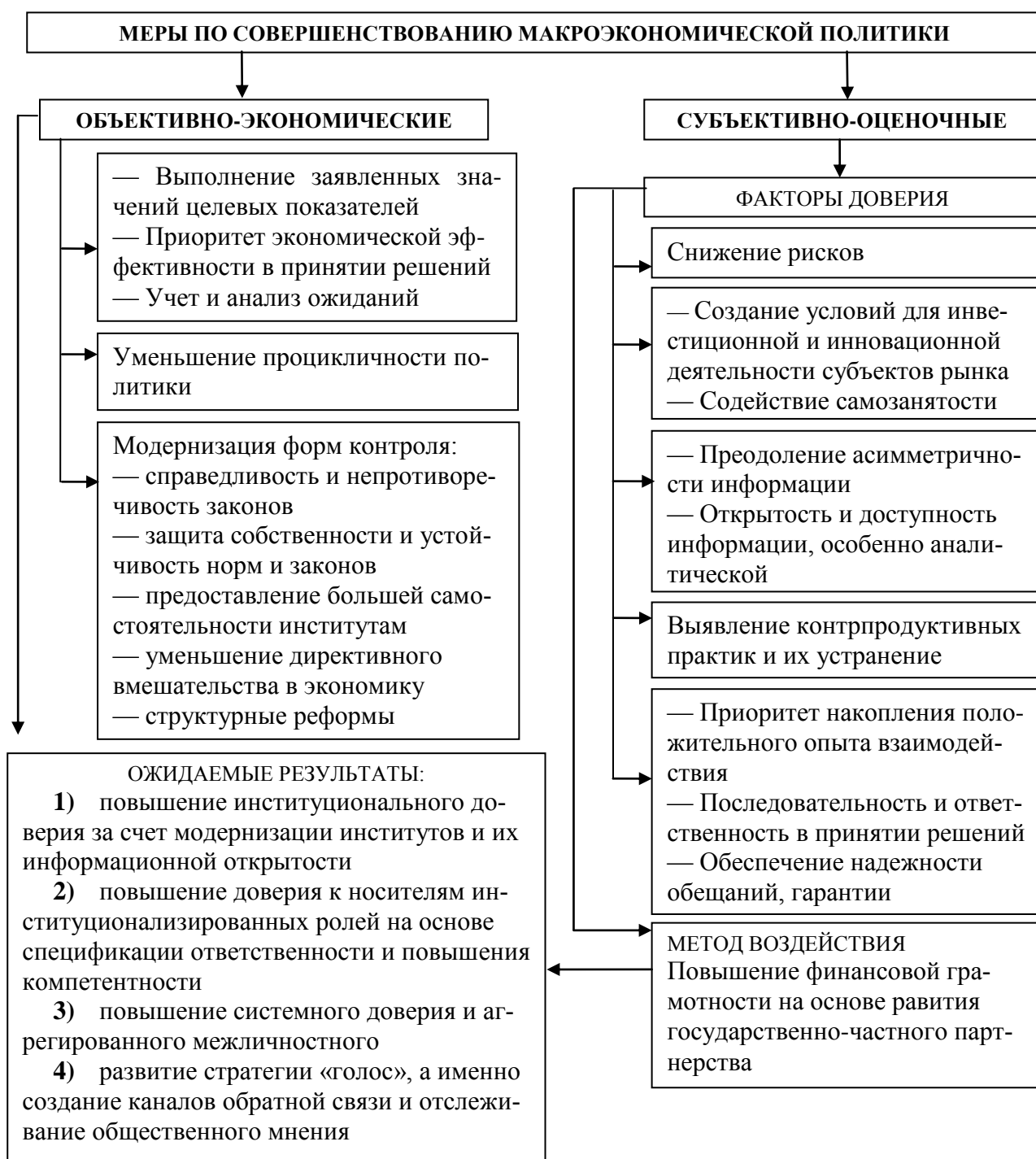
Рисунок 2 — Комплекс мер по совершенствованию макроэкономической политики Республики Беларусь

В контексте повышенных требований к результативности макроэкономической политики предложены практические рекомендации по совершенствованию процесса ее выработки и проведения. Они включают два блока мер, представленных на рисунке 2.