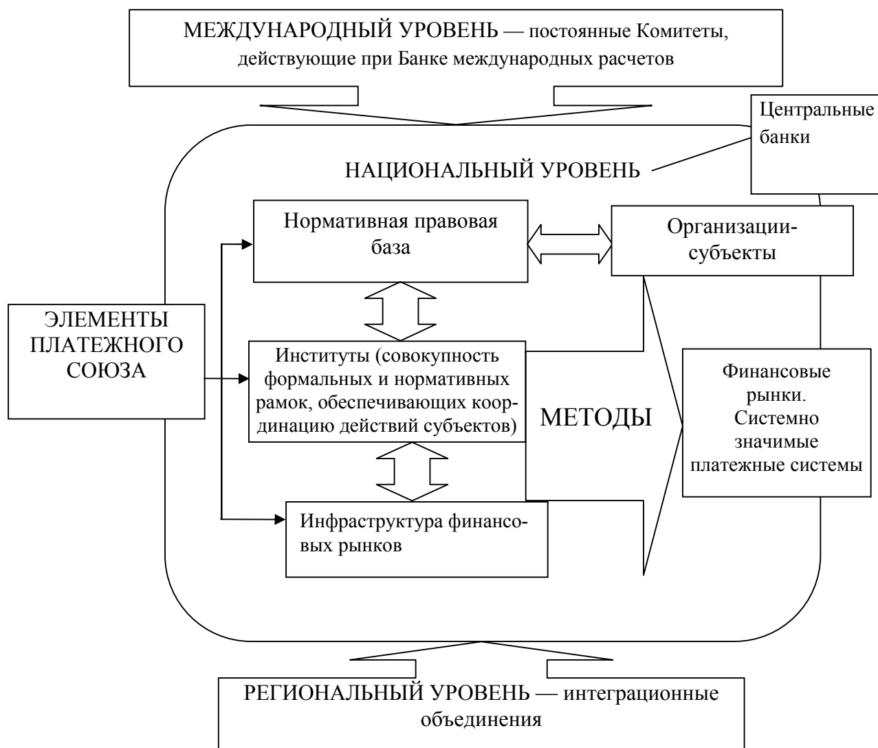
Рисунок 1. — Элементы Платежного союза

Сформулировано авторское определение ПС как формы организации над-государственной валютно-финансовой системы, обеспечивающей централизованные взаимные расчеты и взаимное кредитование дефицитов платежных балансов, которое, в отличие от существующих, позволяет максимально точно отразить суть феномена ПС в экономике.