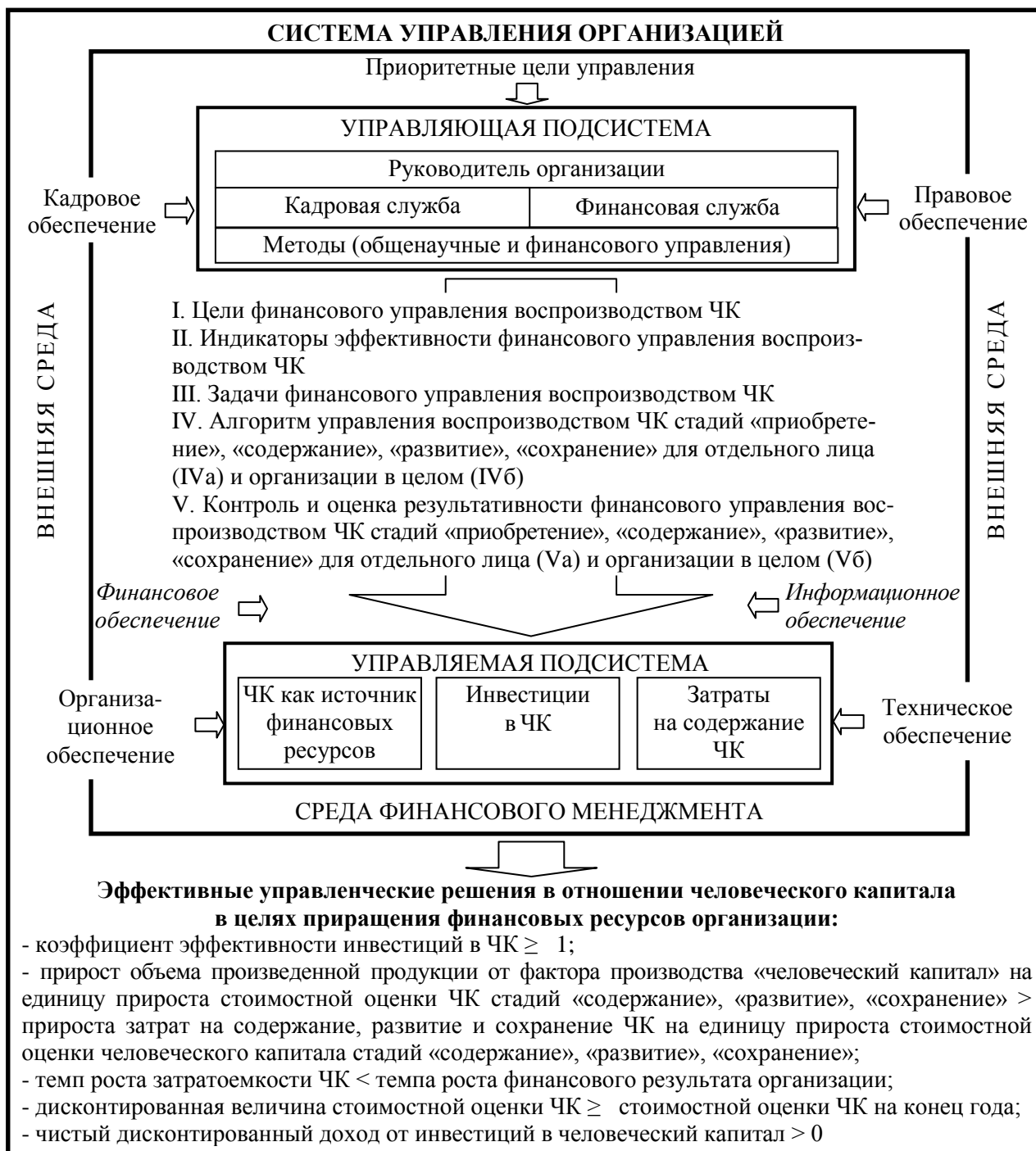
Рисунок 3 — Гармонизированная модель финансового управления воспроизводством человеческого капитала

Формирование гармонизированной модели в контексте всех трех подходов финансового менеджмента позволило целостно представить роль управляющей подсистемы, взаимодействие ее элементов, применяемые методы воздействия на управляемую подсистему, преобразование исходных учетных данных в релевантное информационное обеспечение для принятия решений по финансовому управлению воспроизводством ЧК, возможные варианты управленческих решений на основе принятых индикаторов эффективности финансового управления.