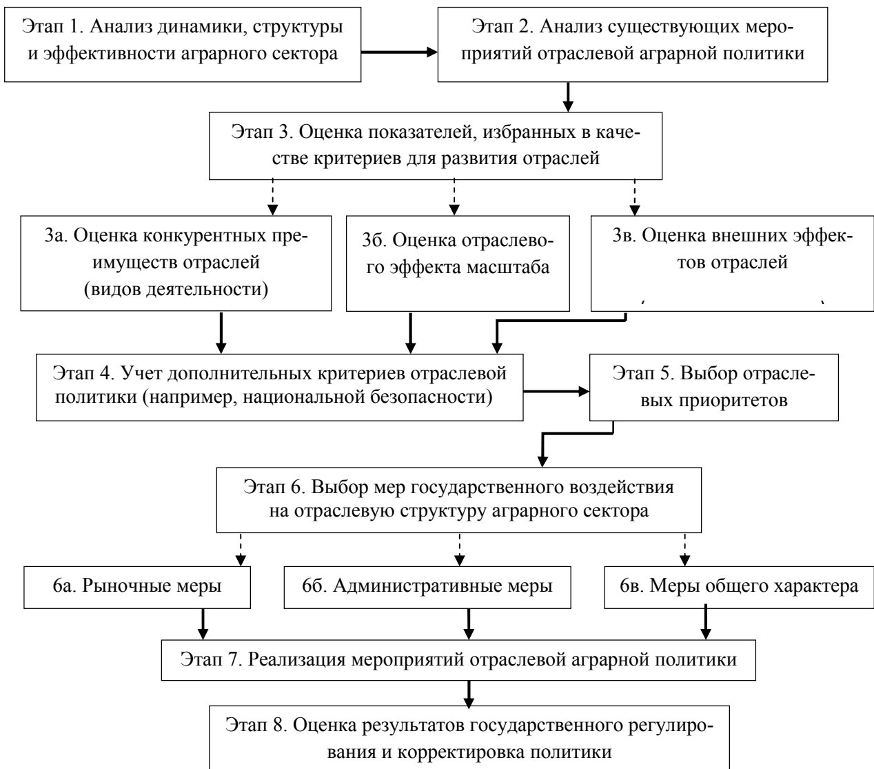
Рисунок 3. — Алгоритм отраслевой аграрной политики

Если стратегией будет избрано развитие рыночных отношений в аграрном секторе, повышение степени самостоятельности сельскохозяйственных организаций в принятии решений относительно объемов и структуры производства продукции, то важнейшим фактором, влияющим на структуру производства, станет конъюнктура мировых рынков продовольствия и сельскохозяйственного сырья. Воздействие же государства на структуру производства станет косвенным, осуществляемым через систему господдержки в соответствии с требованиями ВТО.