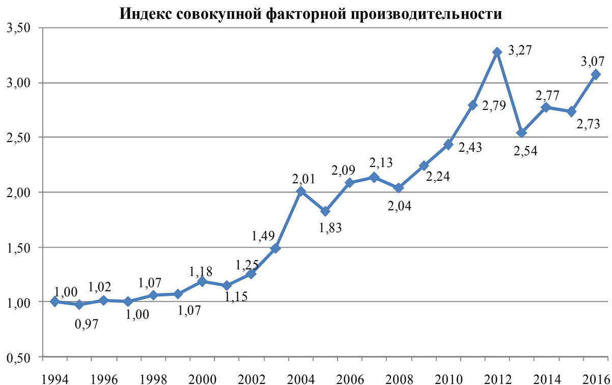
Рисунок 2. — Динамика индекса совокупной факторной производительности в сельском хозяйстве Республики Беларусь

В-третьих, оценены сдвиги в отраслевой и региональной структуре сельскохозяйственного производства Беларуси. Отраслевая структура, измеренная по выручке от реализации продукции, изменилась значительно, чем структура, измеренная по себестоимости проданной продукции, так как соотношение цен на различные виды сельскохозяйственной продукции в рассматриваемом периоде изменялось сильнее, чем физические объемы производства, и сильнее, чем соотношение затрат на производство продукции. Региональная структура валового производства изменялась интенсивнее структуры использования ресурсов в отраслях производства зерна, молока, мяса, яиц, и менее интенсивно — в отраслях производства картофеля, овощей, сахарной свеклы. В разные периоды структурные изменения были разнонаправленными.