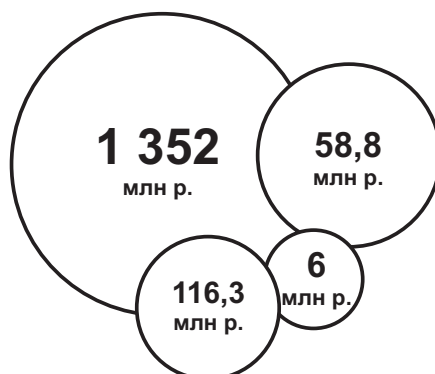
Рис. 3. Рынок e-commerce в Беларуси, 2018 г.

Примечание: наша разработка на основе [3].