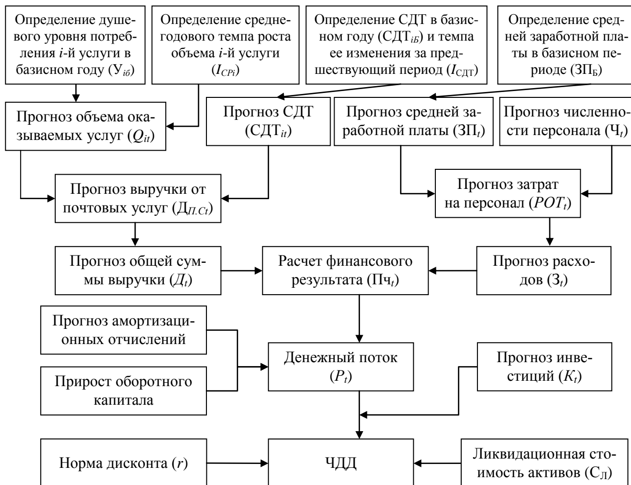
Рисунок 1 — Укрупненная модель формирования ЧДД РУП «Белпочта»

3) в качестве эффекта от реструктуризации выступает прирост ЧДД за установленный временной интервал ( \Delta ЧДД)