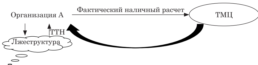
Рис. 2. Легализация товарных ценностей

3) при уклонении уплаты от налогов, сборов и пошлин (ст. 243 «Уклонение от уплаты сумм налогов, сборов» УК РБ) (рис. 3).