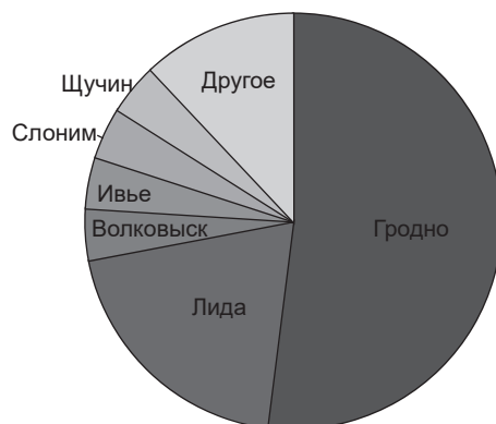
Рисунок 2 — Количество транспортно-логистических организаций в регионах Гродненской области

Исходя из полученных данных, можно сделать вывод, что основные организации, оказывающие транспортные услуги, находятся в Гродно и Лиде. Данные населенные пункты являются основными промышленными центрами Гродненского региона, что обуславливает повышенную востребованность в транспортно-логистических услугах, но недостаточность финансирования и внедрения инновационных технологий тормозят их развитие.