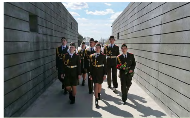
На снимках: студенты и сотрудники БГЭУ возлагают цветы к обелиску в урочище Благовещина Мемориального комплекса «Тростенец»; мемориальный отряд «Батальон» СШ № 131 представляет «заводчан» в городской акции «По праву памяти живой», нес Почетную Вахту Памяти возле Вечного огня в Мемориальном комплексе «Тростенец», а также возложил цветы к «Вратам памяти».

Для ветеранов, а также для всех, кто помнит и чтит подвиг своего народа, в СШ № 109 придумали музыкальную страничку «75 песен Победы». Педагоги и учащиеся составили сборник знаковых и любимых военных песен, как фронтовых, так и созданных в послевоенные годы. «Темная ночь», «Журавли», «Эх, дороги...» — эти песни звучат в школе на переменах, а в День Победы их записи на дисках будут подарены ветеранам. В СШ № 92 работает радиогозета «Служим Оте-