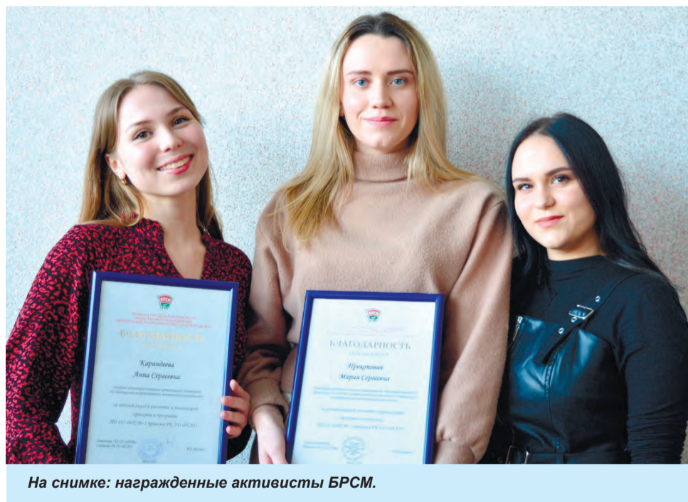
На снимке: награжденные активисты БРСМ.

студенческие отряды. И желающих потрудится на благо других меньше не стало. Как и в прошлом году наши ребята будут работать на ремонте общежитий и корпусов университета, во время приемной кампании, хотим создать сервисные отряды в торговле и на Минсктрансе, летотряды в летних лагерях. Только по моим подсчетам за последние годы число участников студотрядовских формирований выросло в не-