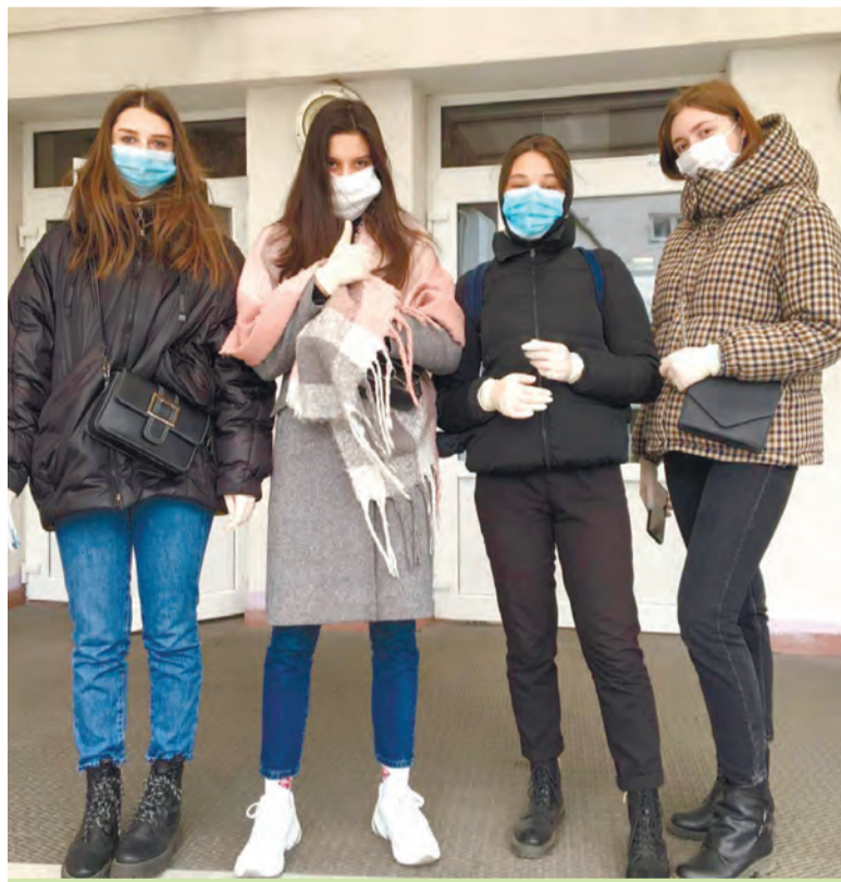
На снимке: волонтеры БГЭУ, студентки 1 курса ФКТИ помогают поликлиникам разносить рецепты.

А.Б.: В первый раз нас собрал организатор, подробно рассказал, что нам предстоит делать и провел инструктаж. В поликлинике нам выдают перчатки, защитные маски, бейджи, сами рецепты и список адресов. Мы разделяемся по парам и доставляем рецепты по адресам.