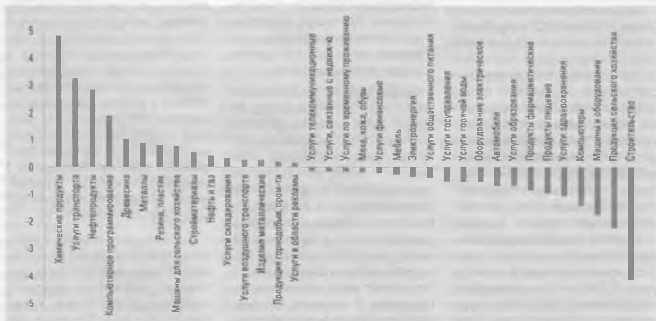
РИС. 2. ВКЛАД ОТРАСЛЕЙ В ТОРГОВЫЙ БАЛАНС, % К ВВП*

• ни одна из трех стран не обеспечивает себя продуктами питания, причем в вопросе продовольственной безопасности Беларусь продвинулась дальше своих соседей. Дезинтеграция пищевой промышленности и сельского хозяйства характерна для Украины, которая, имея тор-