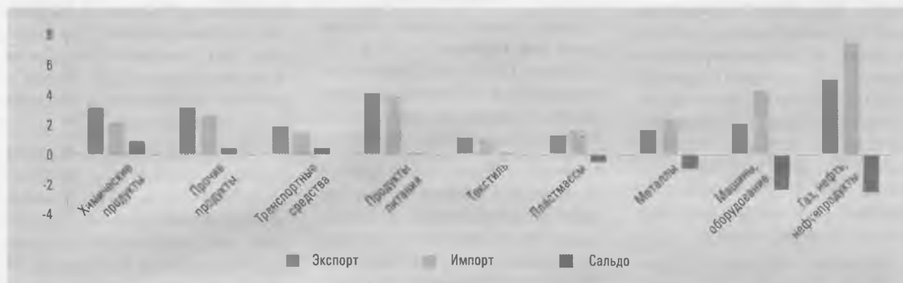
РИС. 1. САЛДО ВНЕШНЕЙ ТОРГОВЛИ БЕЛАРУСИ ПО ВАЖНЕЙШИМ ТОВАРАМ В 2016 г., ПО ДАННЫМ ПЛАТЕЖНОГО БАЛАНСА, МЛРД USD

изводства – мы можем только осуществлять сборку из готовых компонентов (например, у нас производят мотоциклы) либо реализовать полный технологический цикл (так выпускают тракторы). Отметим, что в белорусских автобусах и грузовых автомобилях двигатель и коробка передач импортные, а это составляет до 40% их стоимости. Приведенные примеры показывают, что данных платежного баланса недостаточно для анализа внешне-торговой специализации страны.