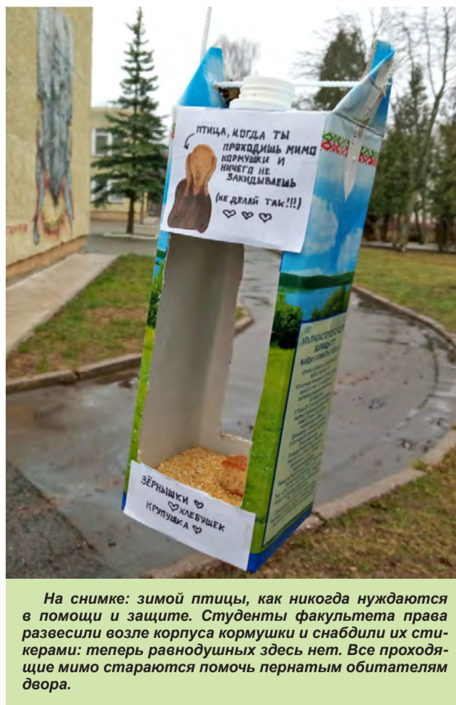
На снимке: зимой птицы, как никогда нуждаются в помощи и защите. Студенты факультета права развесили возле корпуса кормушки и снабдили их стикерами: теперь равнодушных здесь нет. Все проходящие мимо стараются помочь пернатым обитателям двора.