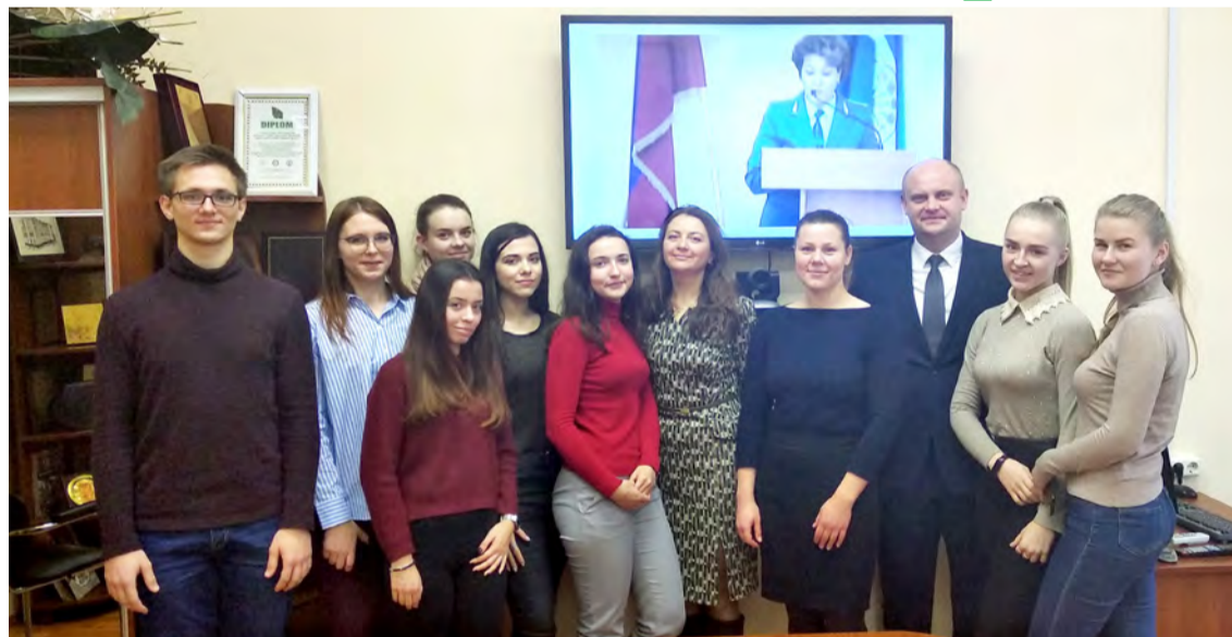
На снимке: участники IV Международной научно-практической конференции «Совершенствование налогового администрирования», которая в формате видео-заседания прошла в БГЭУ (декабрь 2019 г.).

периментального проекта «Университет 3.0» можно назвать подготовку и аттестацию налоговых консультантов. Консультанты – это лица, успешно сдавшие экзамен на получение квалификационного аттестата, и которые имеют право заниматься предпринимательской деятельностью в сфере разъяснения налогового законодательства и представления интересов налогоплательщиков. Кафедра задействована в развитии данного бизнеса в Республике Беларусь.