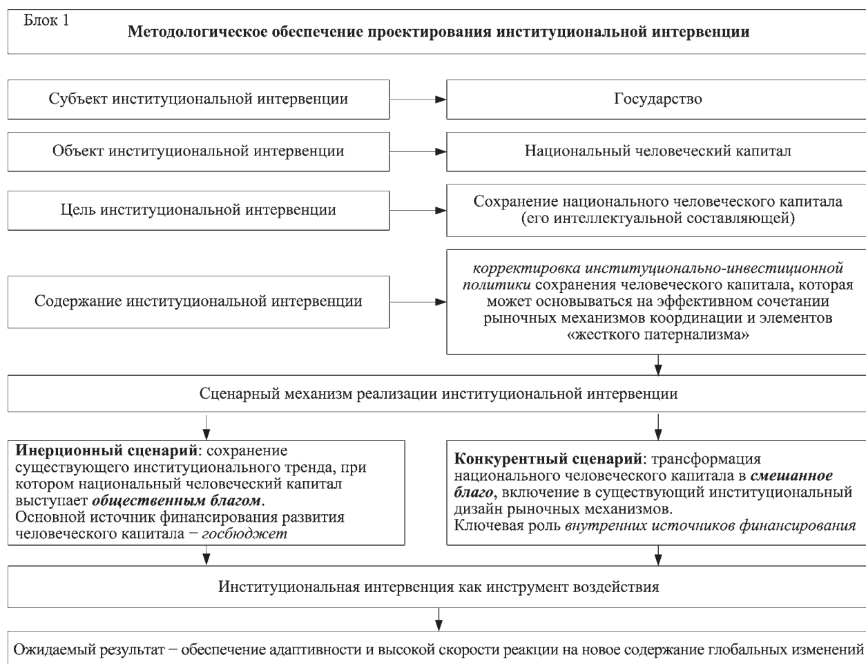
Рис. 2. Схема методологического обеспечения проектирования институциональной интервенции

1.6. Механизм реализации – сценарный подход. Первый сценарий – инерционный . Предполагает сохранение существующего институционального тренда, при котором национальный человеческий капитал выступает общественным благом. В этом случае основным источником финансирования является государственный бюджет. Второй сценарий – конкурентный (рис. 2). Предполагает рассмотрение национального человеческого капитала как смешанного блага. Для этого необходимо включение в существующий институциональный дизайн рыночных механизмов. Второй сценарий может быть реализован по схеме: децентрализация ценообразования на образовательные услуги – усиление конкуренции на рынке образовательных