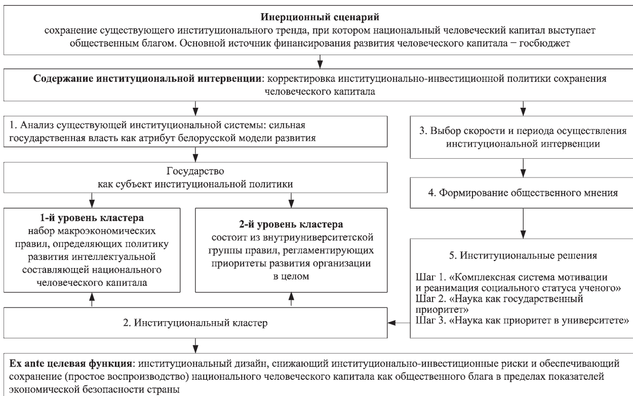
Рис. 7. Механизм реализации инерционного сценария институциональной интервенции