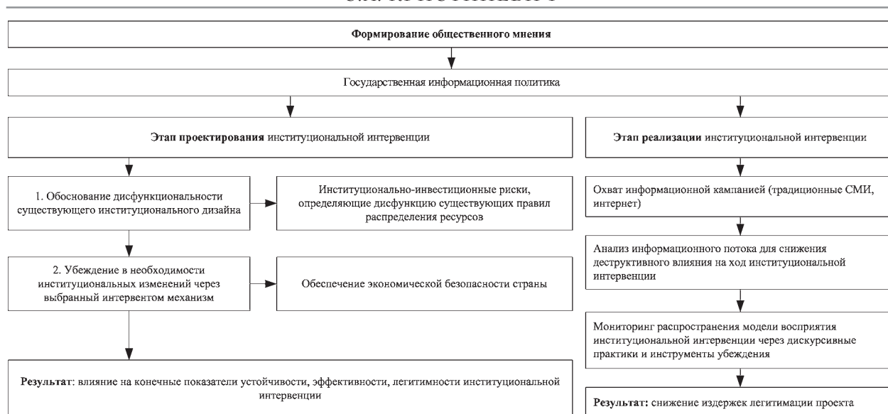
Рис. 6. Процедура формирования общественного мнения при проведении институциональной интервенции