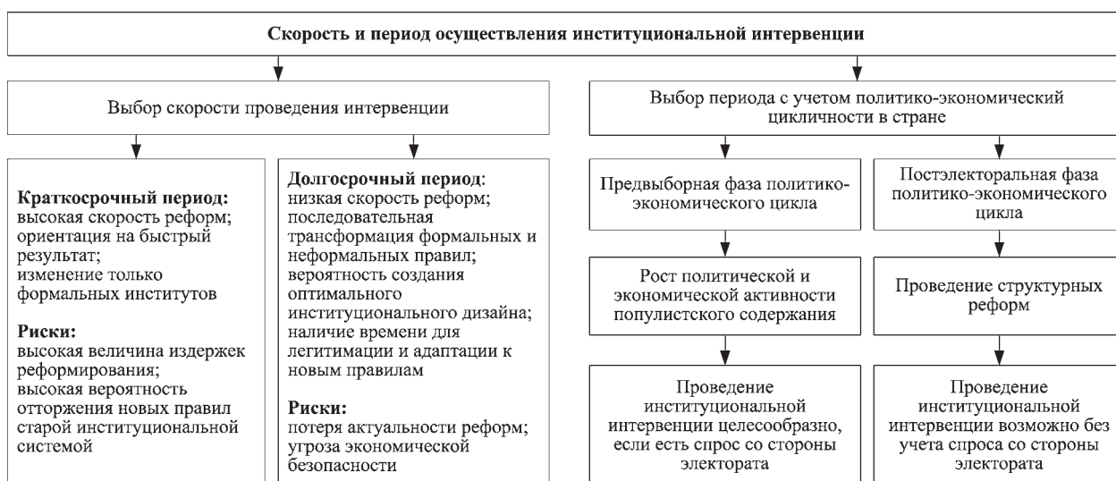
Рис. 5. Алгоритм выбора скорости и периода осуществления институциональной интервенции

4. Формирование общественного мнения. Успешность и эффективность проводимых реформ в определенной степени зависит от их позиционирования на предварительном этапе и информационного сопровождения на этапе их осуществления. В современном политико-экономическом пространстве информация выступает стратегическим ресурсом. В рамках национальных границ, при формировании информационного контен-