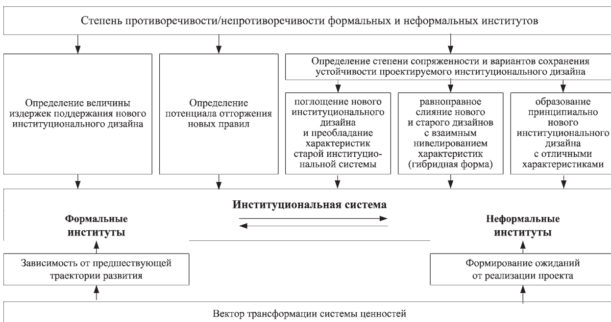
Рис. 3. Схема анализа институциональной системы