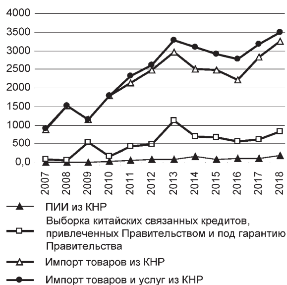
Рис. 2. Импорт товаров и услуг из КНР, выборка китайских связанных кредитов, прямые китайские инвестиции в Беларусь, млн долл.

Выявлена зависимость общего импорта китайских товаров и услуг примерно на 20% от масштаба инвестпроектов, реализуемых при поддержке связанных китайских кредитов (рис. 2). Коэффициент корреляции между импортом китайских товаров и услуг и выборкой китайских кредитов, предоставля-