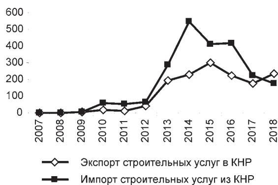
Рис. 3. Экспорт и импорт строительных услуг из КНР, млн долл.

20% в общем экспорте белорусских услуг в КНР составляют транспортные, связанные с экспортом калийных удобрений (рис. 4). Отклонения между двумя показателями возникают из-за колебаний цен на калий и изменений в экспорте услуг разных видов транспорта. При этом ежегодный многократный рост железнодорожных перевозок по маршруту Китай – Европа через Беларусь не смог отвязать экспорт транспортных услуг от экспорта калия, так как китайско-европейские железнодорожные перевозки обслуживают-