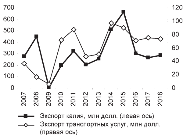
Рис. 4. Экспорт калия и транспортных услуг в КНР