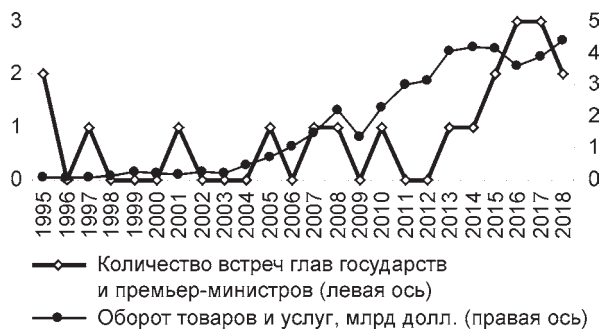
Рис. 1. Общее число двусторонних встреч высшего руководства Беларуси и Китая 1 и взаимный оборот товаров и услуг

нии, ценностях и интересах, определяемых их лидерами (см. подробнее Bougon, 2018). Возросший политический «капитал» стал конвертироваться в экономические (количественные) выгоды для Беларуси по ряду направлений.