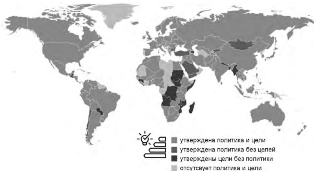
Рис. 1. Страны, применявшие либо не применявшие политику стимулирования использования ВИЭ в 2017 г.

Не оказывалось содействие развитию возобновляемой энергетики и не проводилась соответствующая политика преимущественно в странах Африки и Азии (рис. 1) [1, с. 54].