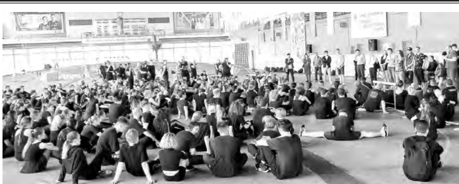
На снимке: волонтеры из БГЭУ репетируют свое выступление на соревнованиях.