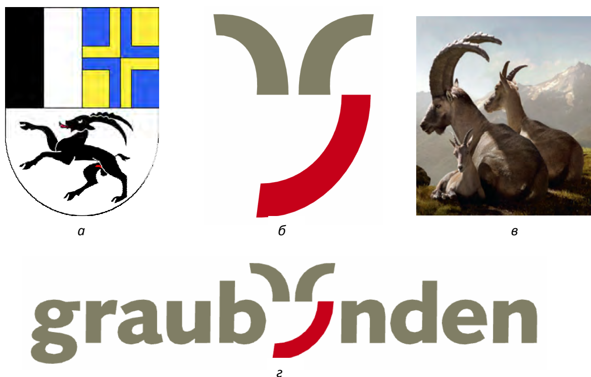
Рис. 2. Герб кантона Граубюнден (Швейцария) (а), фото ибекса – альпийского козла (б), товарный знак Граубюндена (в), логотип округа Граубюнден (г)

В качестве примера приведем разработанный бренд кантона Граубюнден в Швейцарии, который демонстрирует технологию создания бренда как целостного произведения и установления диалога культур через маркетинговые коммуникации. Чтобы убедиться в этом, необходимо посетить сайт данного кантона ( http://www.graubuenden.ch ) и отдельные его страницы, посвященные разработке бренда ( http://www.graubuenden.ch/marke/intro-ci-net/das-ci-net.html ). Для создания бренда был разработан фирменный стиль, который включает 10 элементов: 1) логотип, 2) товарный знак, 3) слоганы (их три), 4) фирменный блок, 5) шрифт, 6) фирменные цвета, 7) особый ракурс фотографий и особенности освещения объектов на фотографиях, 8) центральный символ – ибекс (альпийский козел), 9) присутствие на рекламных фото и в видеороликах профилей типа «V» (например, гора с парной вершиной, человек с поднятыми вверх руками, два отрезанных кусочка ветчины или сыра на столе), 10) аудиоэлемент – голос рога (Stimnhorn, http://www.stimnhorn.ch ).