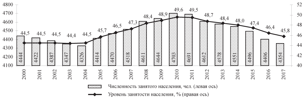
Рис. 2. Динамика численности и уровня занятости населения в Республике Беларусь