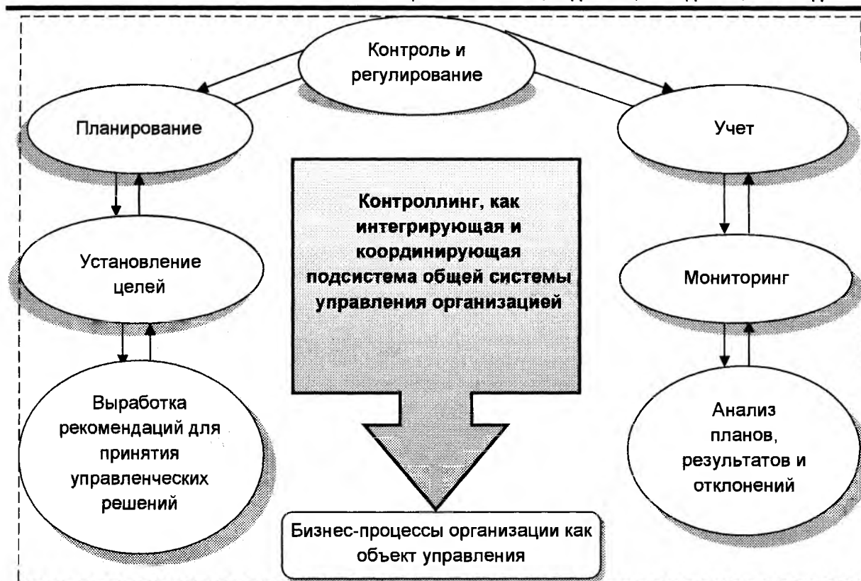
Рисунок 1. Контроллинг в системе управления организации