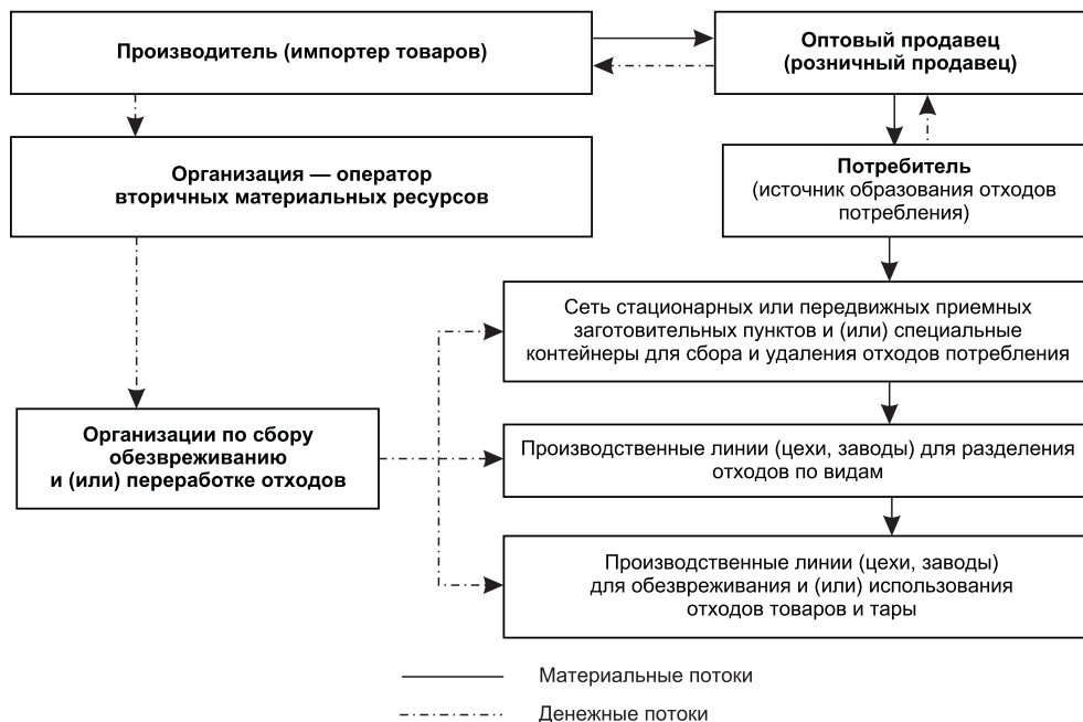
Рис. 3. Организационная модель расширенной ответственности производителя путем заключения договора с оператором