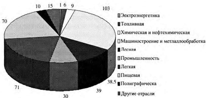
Рис. 1. Структура предприятий по отраслям промышленности по Брестской области в 2000 г.

В общем объеме производства наибольший удельный вес произ-