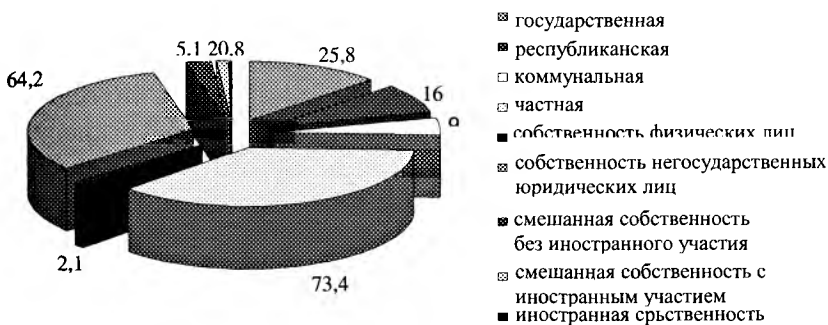
Рис. 3. Структура промышленного производства в общем объеме производства в 2000 г., %.

водства приходится на государственную собственность – 38,5 %, смешанную собственность – 37 и республиканскую – 30,1 % (рис. 3).