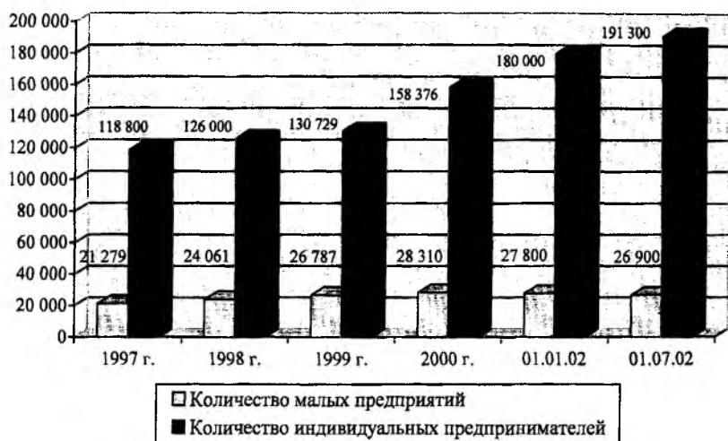
Рис. 1. Динамика изменения численности малых предприятий и индивидуальных предпринимателей за период 1997-2002 гг.

В Беларуси число субъектов малого предпринимательства достигло 29 599, что составляет около 30 % от общего числа предприятий. Численность работающих на них превысила 339 тыс. чел. и составила 7,6 % от численности всех работающих. На долю малых предприятий приходится 5 % объема промышленной продукции, свыше 30 – розничного товарооборота, около 10 % – общего объема итоговых поступлений в бюджет.